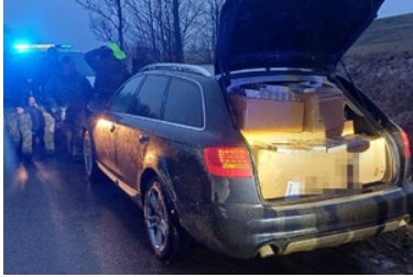
Audi z kontrabandą