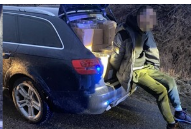
Audi z kontrabandą