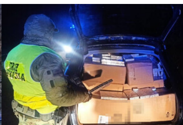
Audi z kontrabandą