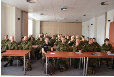
Funkcjonariusze SG rozpoczynają służbę na granicy