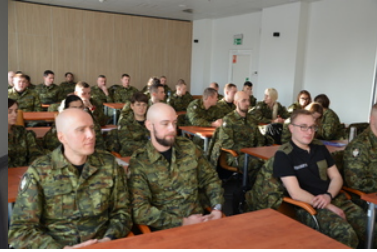
Funkcjonariusze SG rozpoczynają służbę na granicy