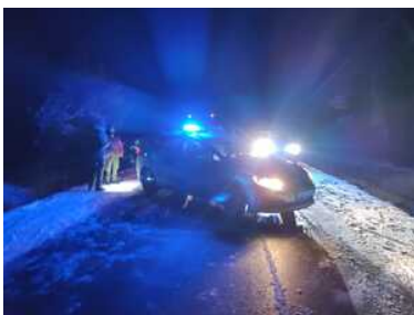
Uciekał z nielegalnymi migrantami

Ostatniej doby funkcjonariusze Podlaskiego Oddziału Straży Granicznej w sumie zatrzymali 3 pomocników w organizowaniu nielegalnego przekraczania granicy.