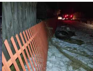
Uciekał z nielegalnymi migrantami