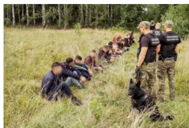
Nielegalni migranci zatrzymani na polsko - białoruskiej granicy

Od początku roku funkcjonariusze Podlaskiego Oddziału Straży Granicznej zatrzymali 871 osób za nielegalne przekroczenie granicy polsko - białoruskiej.