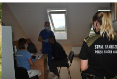
Nielegalni migranci zatrzymani na polsko - białoruskiej granicy