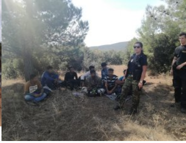
8. edycja operacji w Macedonii