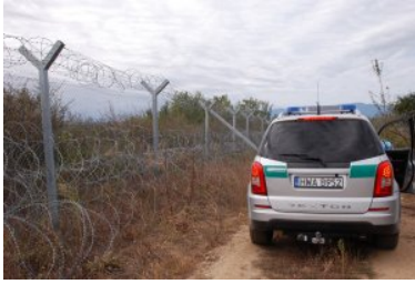
8. edycja operacji w Macedonii