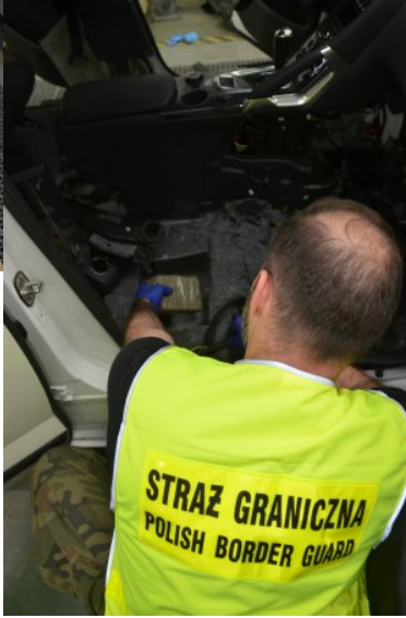
Rekordowy przemyt haszyszu