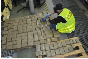
Rekordowy przemyt haszyszu