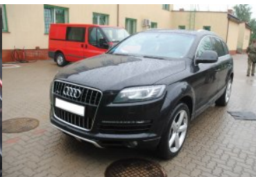
Zatrzymane auto z kontrabandą